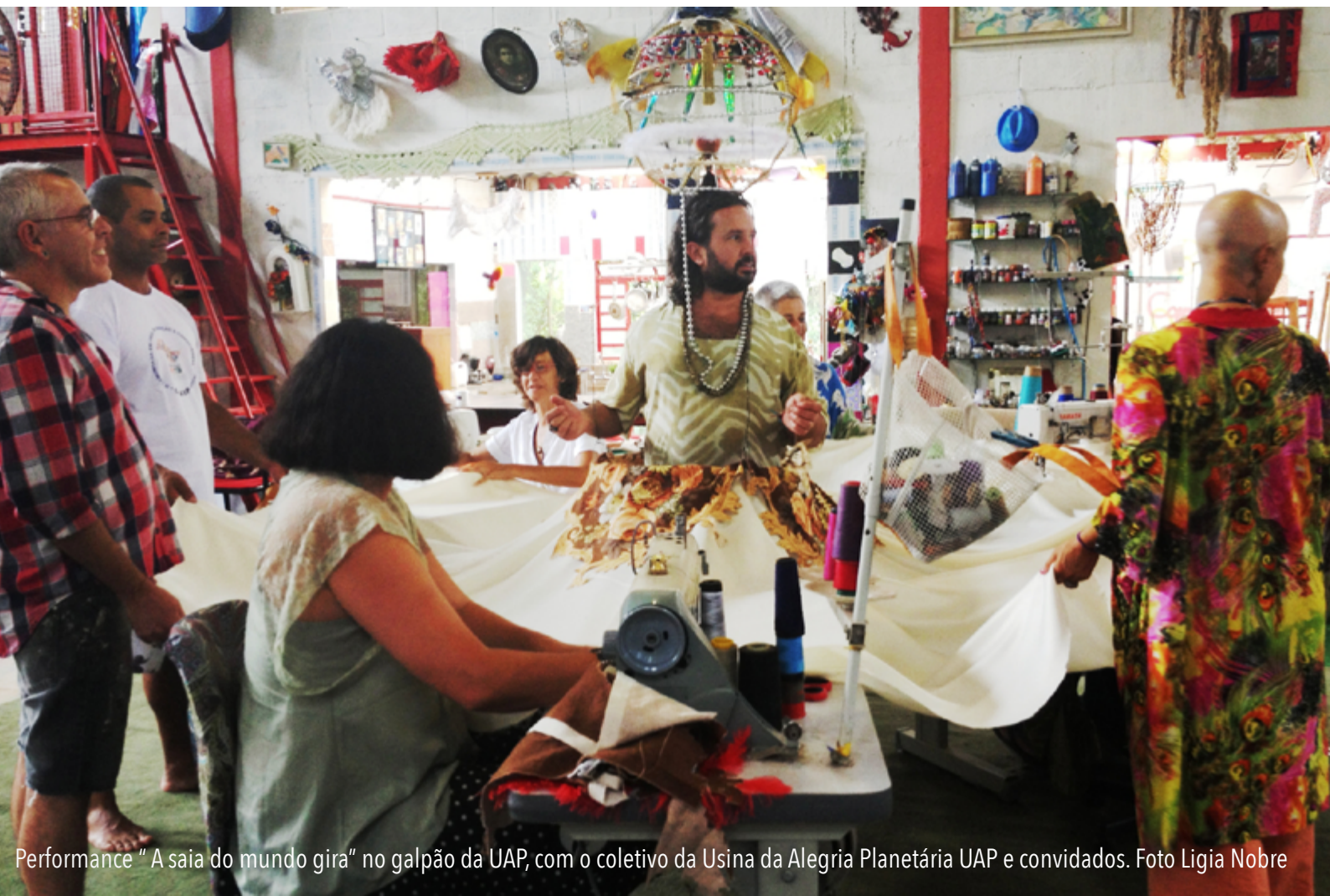
Performance "A saia do mundo gira" no galpão da UAP, com o coletivo da Usina da Alegria Planetária UAP e convidados.

UAP é um centro de pesquisa e criação que, desde 2008, propõe a troca livre entre artistas, em múltiplos formatos, com base na transdisciplinaridade, na experimentação de linguagens e na transformação de materiais, indivíduos e seu entorno. Mais informações e integrantes do grupo AQUI